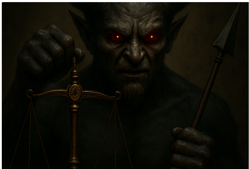
Fig. 1. El Demonio de Laplace concibe tiempo no direccional

La presunta dicotomía es posible hallarla en las producciones del