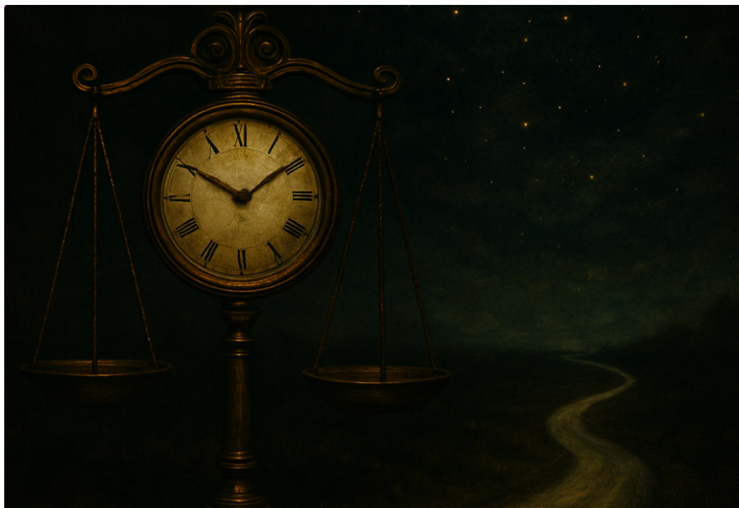
Fig. 3. La relación del tiempo y del espacio tienen una explicación relativa en la actualidad

Como último comentario, cabe recordar que hasta los últimos hallazgos de la física hacen hincapié en la profunda relación del tiempo y el espacio, y que los procesos de percepción humanos son fenómenos de la